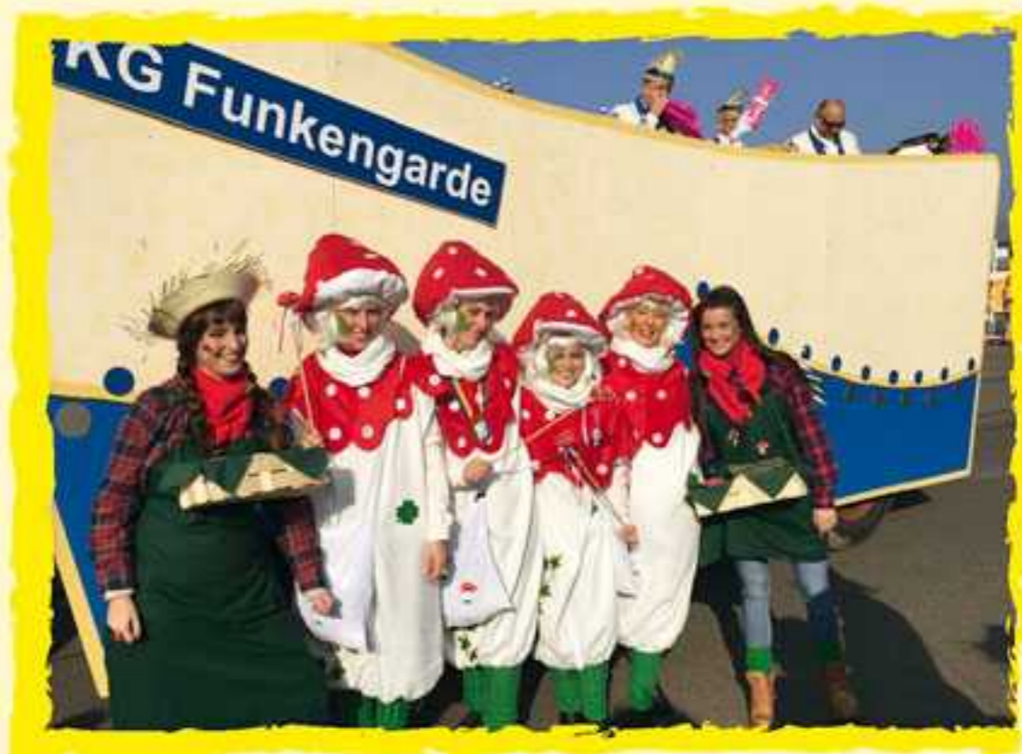
Teil der Fußgruppe der KG Funkengarde Alsdorf im Rosenmontagszug.

Auch die kleinen Narren kommen in der Session wieder voll auf ihre Kosten. Am Sonntag, 24. Januar 2016, findet in der Festhalle Ofden die Kindersitzung der KG Funkengarde Alsdorf statt. Es warten viele gemeinsame Spiele, Auftritte der