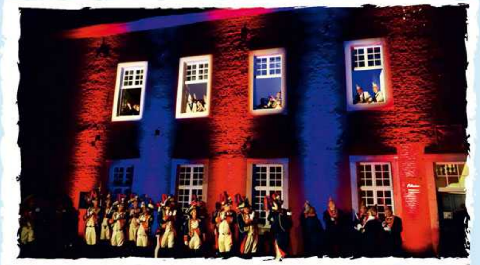
So farbenfroh und stimmungsvoll wie bei der Sesslonseröffnung im Burghof wird auch das außerordentliche Programm der Jubiläumssitzungen bei der Prinzengarde.

„Mit 66 Jahren, da fängt das Leben an, mit 66 Jahren, da hat man Spaß daran“, hat Udo Jürgens gesungen. Und Alsdorf wird eine Menge Spaß mit der Prinzengarde haben, beim Jubiläum noch mehr als in den 66 Jahren zurückliegenden Jahren. Dieses Mal lässt es die Garde richtig krachen. Übrigens: Das mit dem Zug, der in den „Bahnhof“ Stadthalle einfährt, ist durchaus wörtlich zu verstehen. Die Bühnenbildner der Garde haben sich da schon