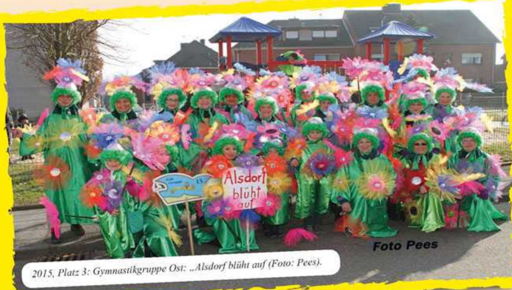
2015, Platz 3: Gymnastikgruppe Ost: „Alsdorf blüht auf“.

Die Bewertung der Fußgruppen für die Prämierung, die wie bisher nach dem Rosenmontagszug in der Stadthalle durchgeführt wird, erfolgt wie folgt: Das Verhalten der Gruppe (Darstellung im Zug) wird