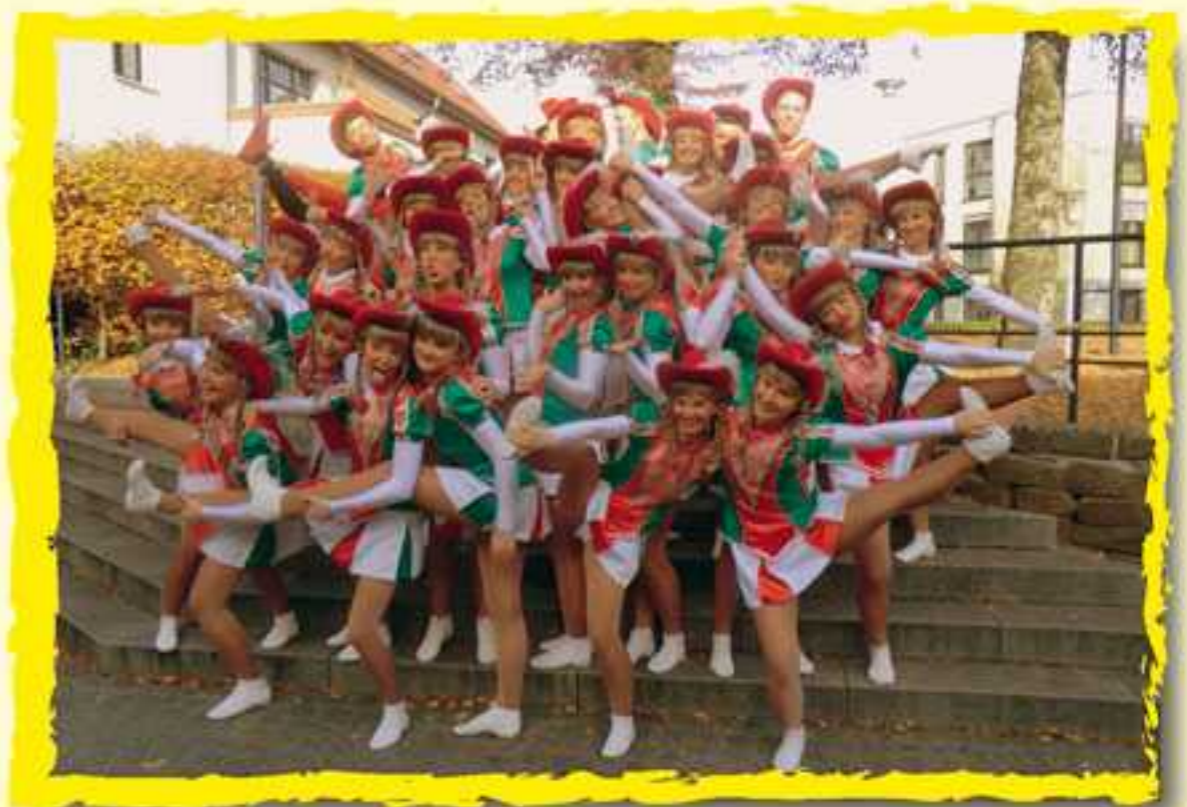
Die Zechengarde und die Glück-Auf-Garde.