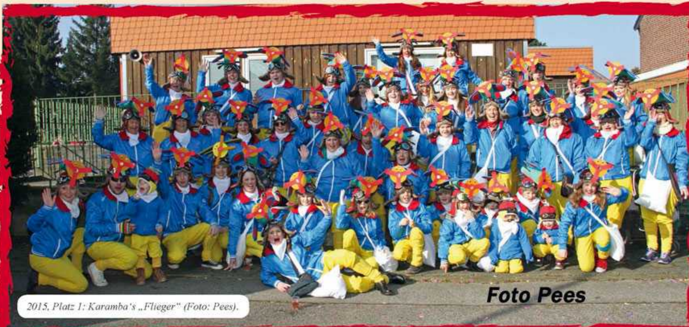
2015, Platz 1: Karamba's „Flieger“.