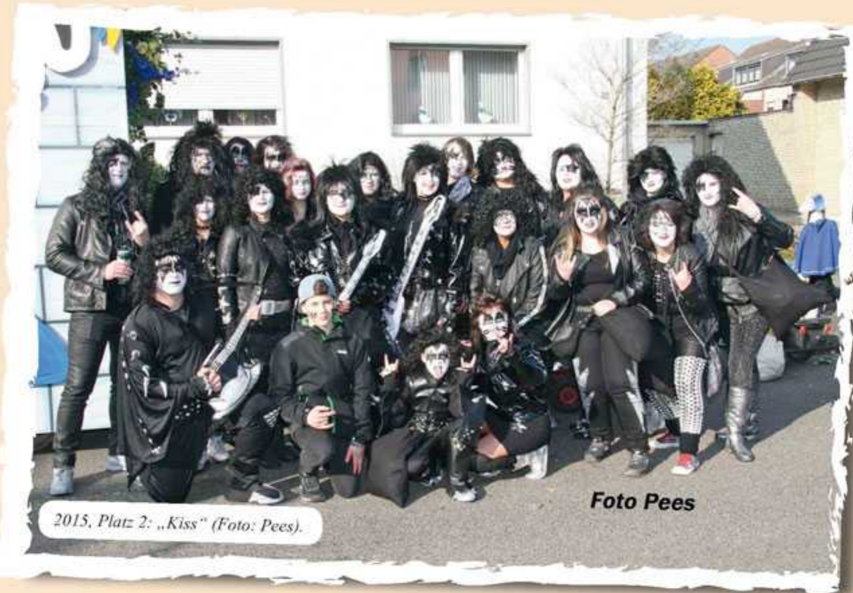
2015, Platz 2: „Kiss“.