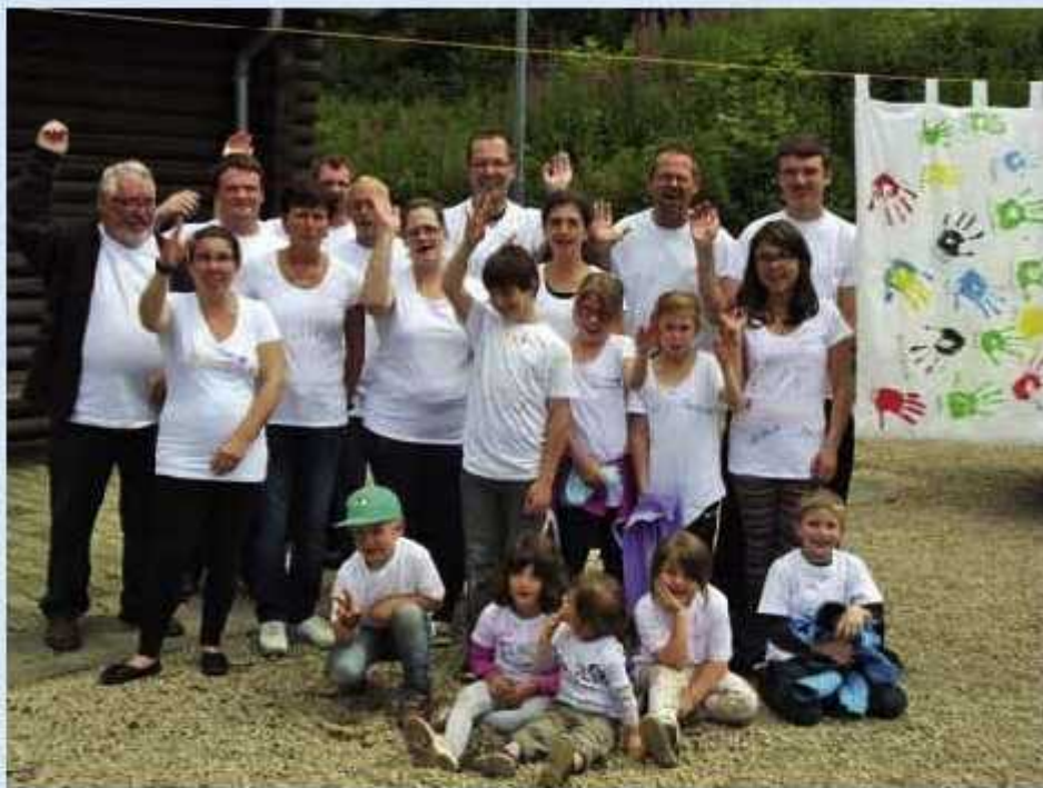
Die KG Stadtgarde Alsdorf ist nicht nur während der Karnevalszeit aktiv, sondern bietet ihren Mitgliedern das ganze Jahr über attraktive Freizeitangebote.