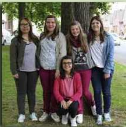
Die Kindergärtnerinnen begleiten in dieser Session erstmals das Alsdorfer Kinder-Prinzenpaar

Seit den Sommerferien herrscht in der Hofburg des Kinderprinzenpaares „Haus Kiste.s“ in Alsdorf Busch Karnevalsstimmung. Denn bei den wöchentlichen Proben werden die Leder und Tanzschritte für