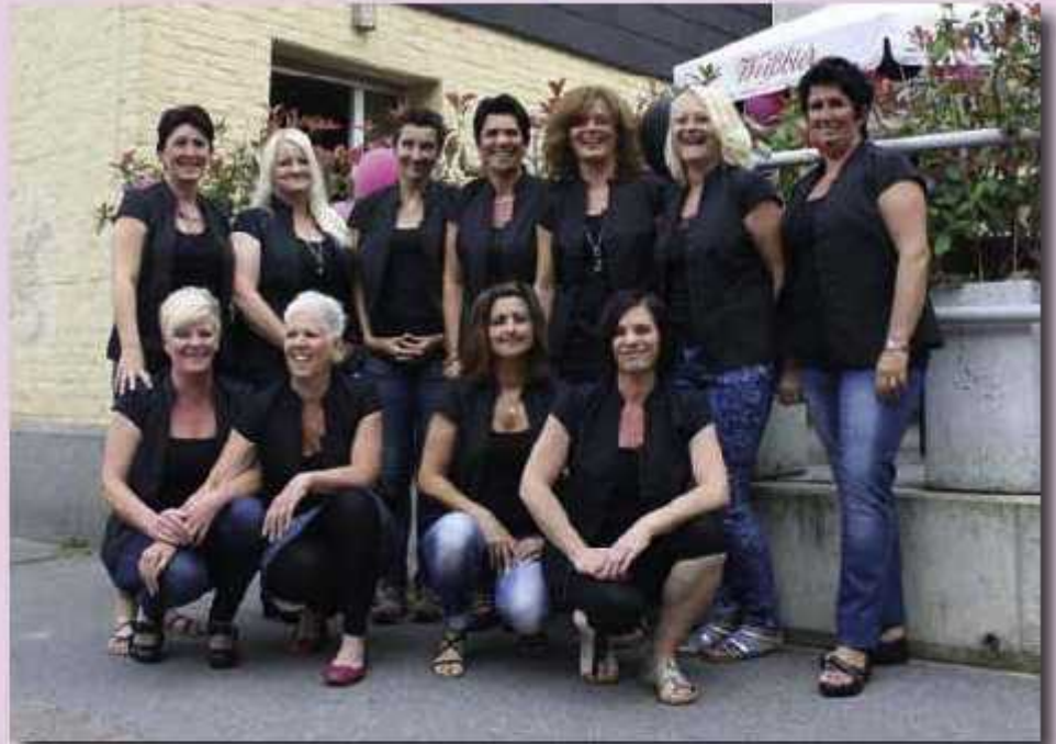
Der Gründungsvorstand der „Jecken Mädels op Zack“

Alle Mädels gingen tatkräftig und mit viel Freude und Ehrgeiz ans Werk. Neben den Formalitäten wie z. B. die Erarbeitung einer Satzung waren die Damen der Gesellschaft auch kreativ tätig. In Kürze entstanden das Design der Uniform, des Mitgliedsordens sowie des Pins. Nach längerer Überlegung und weiteren Treffen stand auch der Vereinsname „KG Jecke Mädels op Zack“ fest.