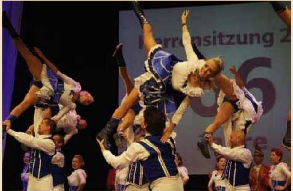
Acrobatische Höchstleistung von Spitzengarden – ein schter Hingucker.

Weil das so ist, liebe Freundinnen und Freunde des TPJ-Sitzungskarnevals, haben die Jonge doch bestimmt auch einen Extra- applaus verdient! Sie würden sich sehr dar- über freuen. Und die KG Tröter Pötzer Jon- ge freut sich auf viele gut gelaunte Gäste. Alsdörp Alaaß!